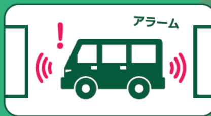
誤発進警報機能 (前方・後方)