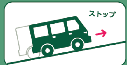
坂道発進サポート機能