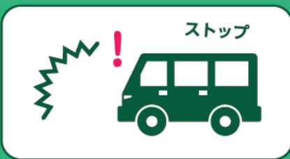
自走事故防止システム