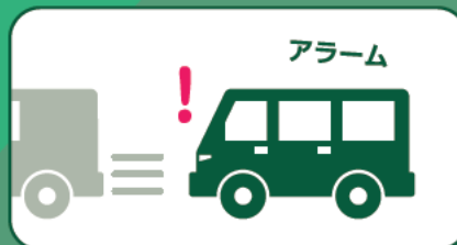
前方車両発進通知機能