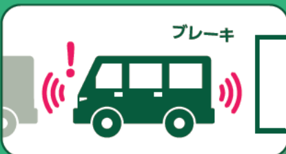
衝突被害軽減ブレーキ (前方・後方)