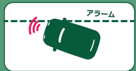
車線逸脱警報機能